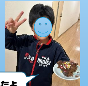
ホワイトデーは手作りでお返しだよ

令和6年2月24日(土)に懲戒権濫用の有無の聴き取り調査を実施しました。各ユニット・ホームから2名ずつの計16名の児童を対象に行われました。外部委員の方からの聴き取りを実施した結果、懲戒権濫用はありませんでした。